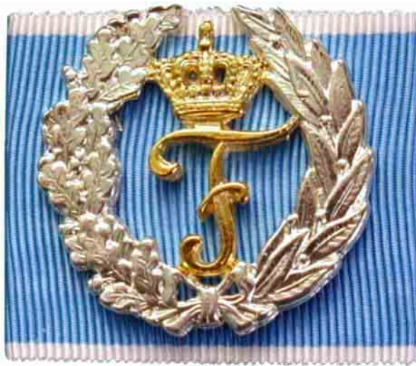
Protektorzeichen (große Ausführung)

Jeder Verein, der mindestens fünf Jahre Mitglied des BSSB ist, kann für einen Zeitraum von jeweils fünf Jahren für je 20 seiner Mitglieder die Erteilung eines Zeichens beantragen und es an Mitglieder vergeben, welche die Voraussetzung für die Verleihung erfüllen. Die Anträge (Anlage 4) sind an den Gauvorstand zu richten. Der Ehrungsausschuss prüft die Anträge und gibt sie bei Befürwortung an die Geschäftsstelle des BSSB weiter. Das Zeichen wird mit einer Urkunde geliefert, in die noch der Name der zu ehrenden Person und das Verleihungsdatum eingesetzt werden müssen. Die Miniatur wird gegen Aufpreis mitgeliefert.