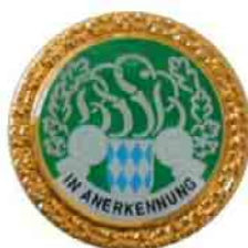
BSSB-Ehrennadel „In Anerkennung“

Die grüne Verdienstnadel „In Anerkennung“ wird an Vereinsfunktionäre im Schützenwesen verliehen. Jedem Bezirk wird für 200 Mitglieder jährlich eine Verdienstnadel zur Verleihung zugeteilt. Die Anträge für die Verleihung dieser Ehrennadel sind von den Vereinen bei dem Gau Neuhausen-Altstadt im BSSB einzureichen. Diese Ehrung kann mit dem Ehrungsantrag des Gaus (Anlage 2) oder des Bezirkes (Anlage 3) beantragt werden.