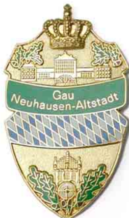
Ehrenzeichen in Gold

Das Ehrenzeichen in Gold wird für länger währende Verdienste auf Vereinsebene verliehen. Voraussetzung für die Verleihung ist der Besitz des Ehrenzeichens in Silber. Ausnahmen hiervon kann der Ehrungsausschuss beschließen.