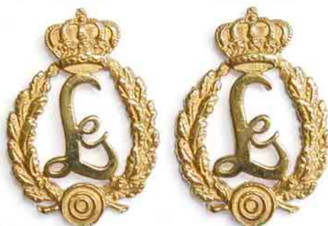
Kragenspiegel in Gold

Der Maßstab für die Entscheidung über die Verleihung der Kragenspiegel in Gold ist, ob sich die zu ehrende Person insgesamt mehr als fünf Jahre überdurchschnittlich im Gau und den ihm angeschlossenen Vereinen und Gesellschaften verdient gemacht hat und mindestens zwei Jahre seit der Verleihung der Kragenspiegel in Silber vergangen sind.