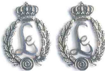
Kragenspiegel in Silber

Der Maßstab für die Entscheidung über die Verleihung der Kragenspiegel in Silber ist, ob sich die zu ehrende Person mehr als drei Jahre nach der letzten Ehrung überdurchschnittlich im Gau und den ihm angeschlossenen Vereinen und Gesellschaften verdient gemacht hat.