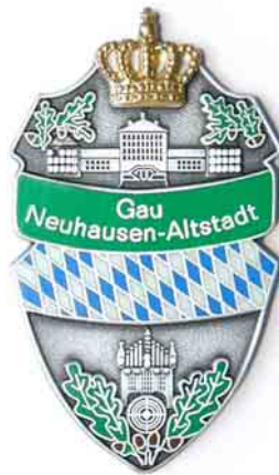
Ehrenzeichen in Silber

Das Ehrenzeichen in Silber ist die niedrigste Ehrung des Gaues Neuhausen-Altstadt im BSSB. Es wird für Verdienste auf Vereinsebene verliehen. Sein Vorbesitz ist Voraussetzung für höhere Ehrungen.